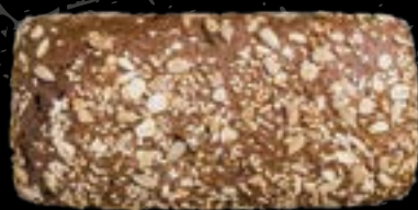
Cereali* 1 Cereals