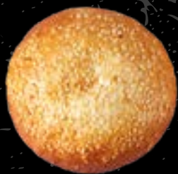
Classico* 1 Classico