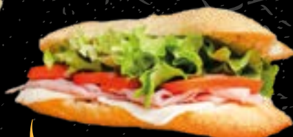
Baguette * 1 Baguette