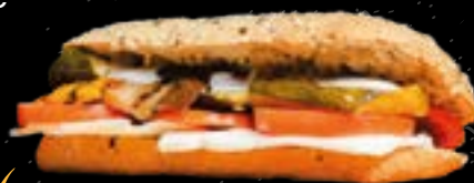
Ciabatta ai 5 cereali * 1 (SUPPLEMENTO € 1,00) Ciabatta with five cereals (SUPPLEMENT € 1,00)