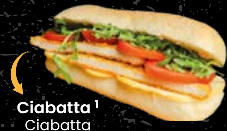
Ciabatta 1 Ciabatta