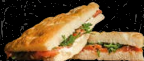
Focaccia 1 (SUPPLEMENTO € 2,00) Focaccia (SUPPLEMENT € 2,00)