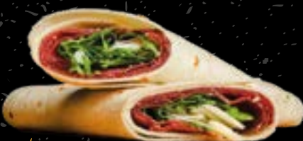
Piadina 1 Piadina