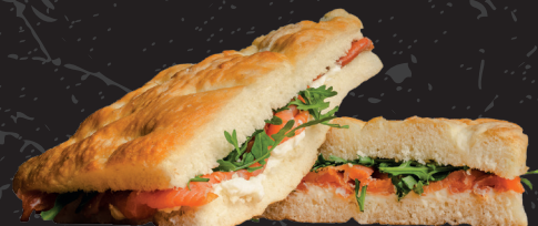
Focaccia 1 (SUPPLEMENTO € 1,00) Focaccia (SUPPLEMENT € 1,00)