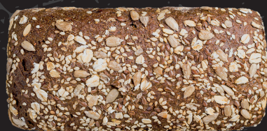
Cereali* 1 Cereals