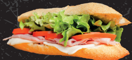
Baguette * 1 Baguette