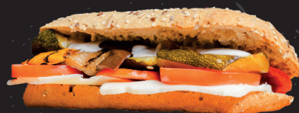
Ciabatta ai 5 cereali * 1 (SUPPLEMENTO € 1,00) Ciabatta with five cereals (SUPPLEMENT € 1,00)