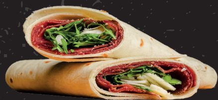
Piadina 1 Piadina