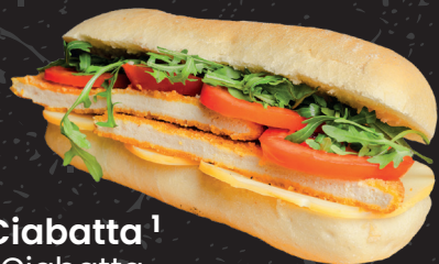
Ciabatta 1 Ciabatta