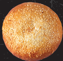
Classico* 1 Classico